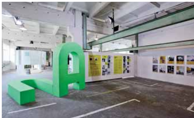
1 Dočasná výstava AU ; foto: Valerij Miloserdov.

Doba, kterou tito odborníci na Ukrajině strávili, byla rozdělena do několika studijních fází. Součástí terénního výzkumu bylo několik cest do Mariupolu. Cílem bylo nasbírat a zpracovat data ke studiu architektury prizmatem inovativních zásahů v městském kontextu. Účastníci programu a členové iniciativy IZOLJACIJA se také setkali se zástupci společenského a kulturního života ve městě. V Kyjevě se poté uskutečnil výzkum sekundárních zdrojů. Shromážděná data určila formát závěrečných projektů, jež byly představeny ve formě pracovního návrhu, tedy Dočasné výstavy AU.