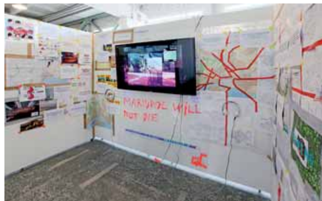
3 METASITU: #mariupolwillnotdie #itistheworldthatwillend (#mariupolnezemře #jetosvětktěryskončí) ; foto: Valerij Miloserdov.

V současné době se pohybujeme v kapitalistické struktuře a očekává se, že budeme aktivně vytvářet plány růstu. Plánujeme města, vytváříme utopie, které jsou často velkorysejší než realita. Avšak následky tvorby falešných strategií pro větší města, popírající fakt, že se ve skutečnosti zmenšují, nás odsuzují k neúspěchu. Co by se stalo, kdybychom se smířili se zmenšováním? Jaké by bylo plánovat a přitom počítat se zmenšením, nikoli s růstem?