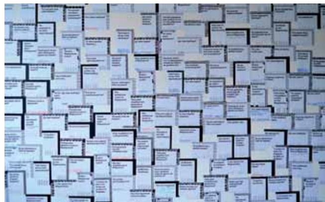
4 Danielle Rosales a Robin Coenen: Vizuální jazyk Mariupolu.

Množství zmenšujících se měst po celém světě v posledních letech zvolilo různé přístupy ke snížení počtu svých obyvatel. „Chytrý pokles“ nebo „strategické zmenšování“ se staly moderními klíčovými pojmy. I přesto si myslíme, že tyto strategie často zastírají záměry růstu namísto smíření se skutečností. V METASITU se domníváme, že musí nastat změna paradigmatu, kdy města akceptují svoji situaci zmenšování a aktivně ji plánují. To může otevřít mnoho nových možností, které budou experimentovat s konsenzuálním rozhodovacím procesem, kdy se občané shromáždí, aby vytvořili plány pro svou společnou budoucnost – na zredukované matici.